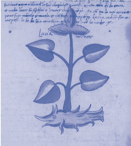
Imagen de dominio público Erbario: a 15th-century Herbal from Northern Italy

— ¡Oh! Miren esa raíz con forma de animalito. ¿Les gustaría dibujar una planta inventada?