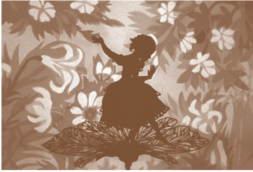
Fotograma de Thumbelina (Pulgarcita), animación de Lotte Reiniger. Alemania, 1955.

sacha: en quechua, prefijo que significa 'casi', 'silvestre' o 'del monte'.